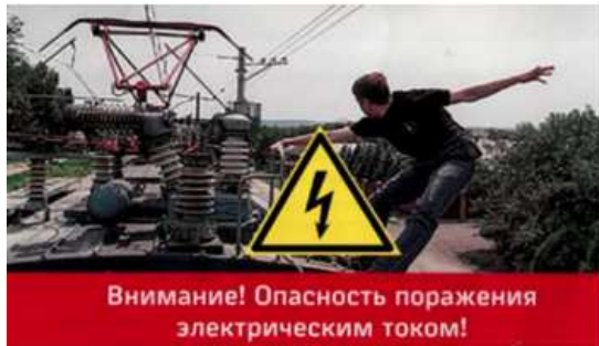
Напряжение контактной сети - 27500 вольт

Под действием напряжения может произойти поражение электрическим током как внешних, так и внутренних органов человека. К самым тяжелым последствиям приводят поражения нервной, дыхательной и сердечнососудистой систем.